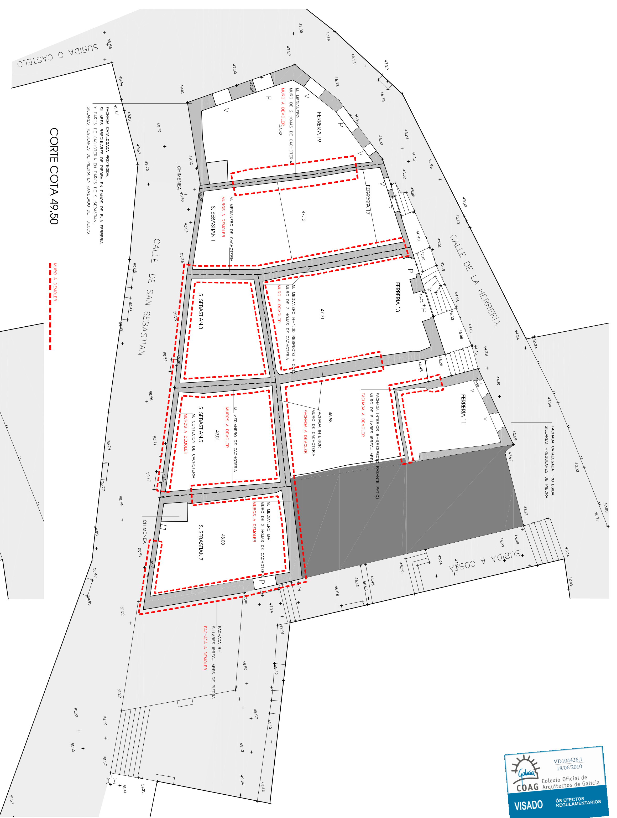
CORTE COTA 49.50